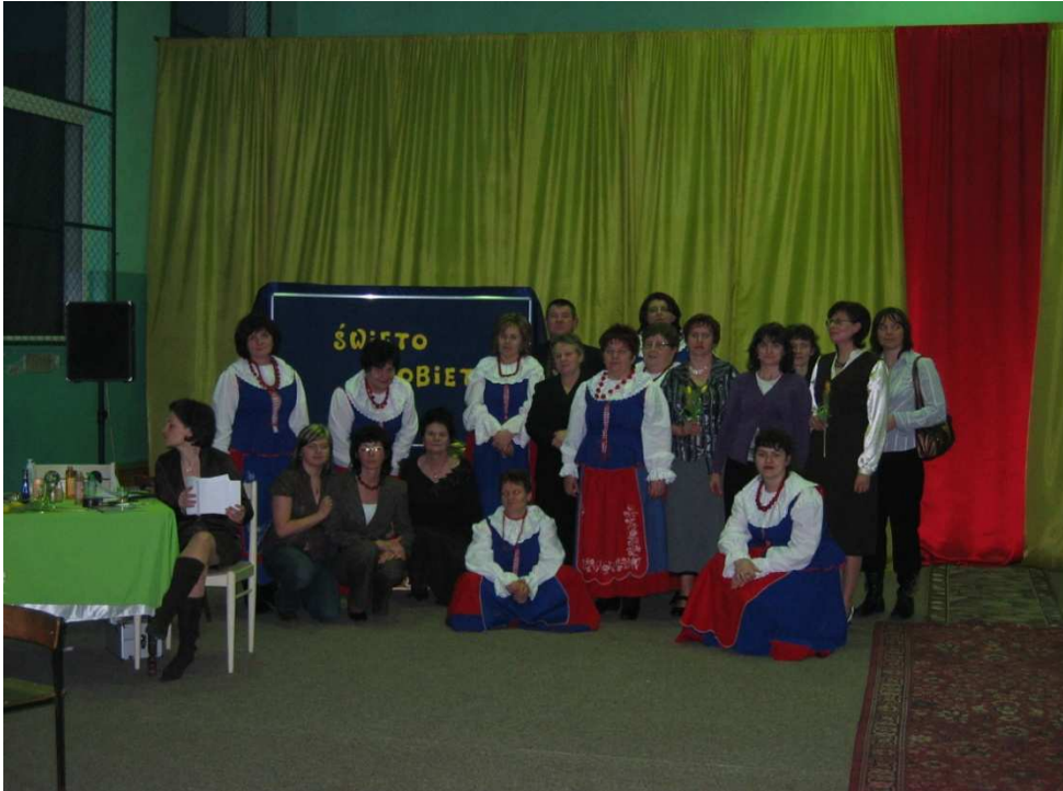
Dzień Kobiet w Ludzisku