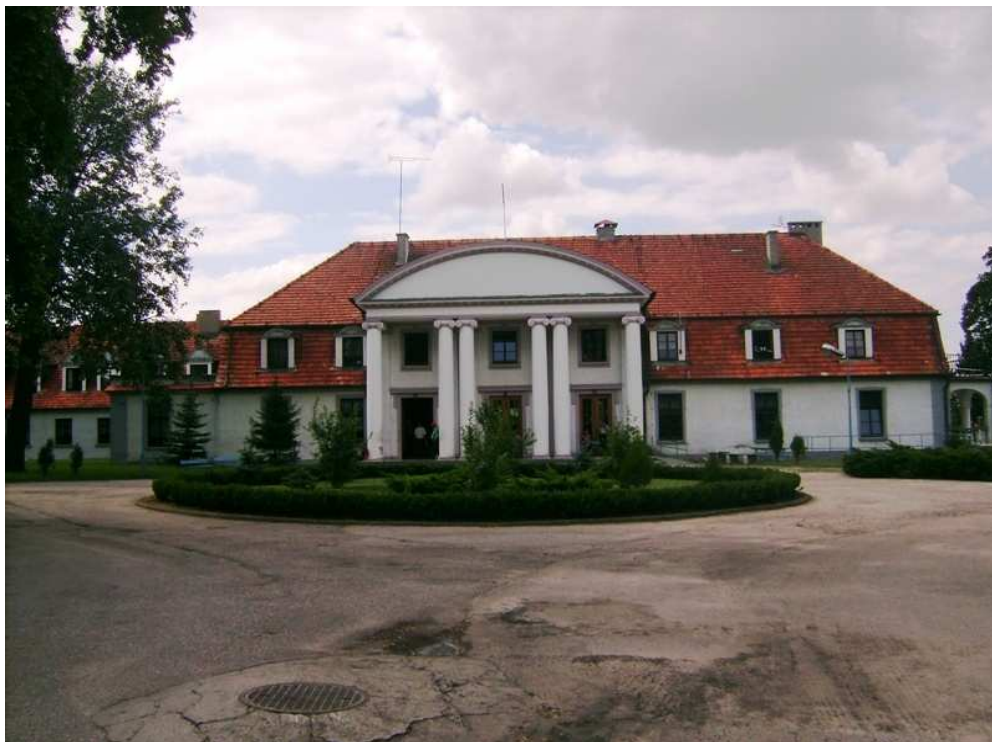
Dwór w Ludzisku

całym zapleczem architektonicznym – z oficynami, czworakami i parkiem, który został założony równocześnie z dworem.