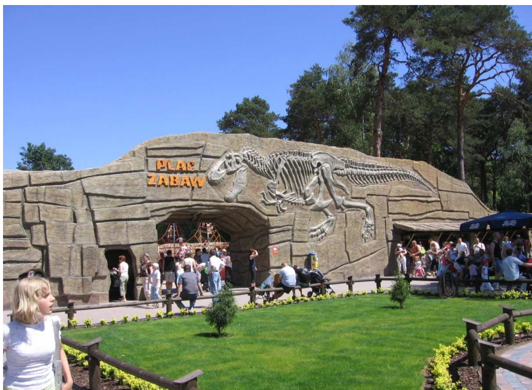
Wycieczka edukacyjna dla dzieci