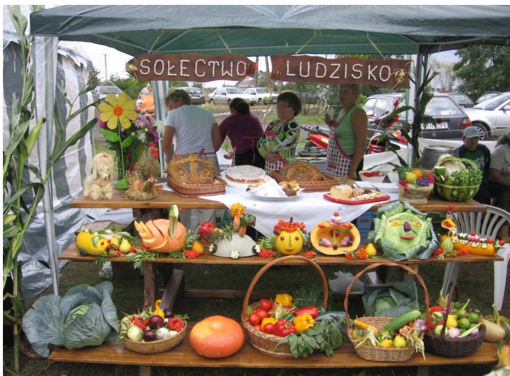
Święto Plonów – dożynki gminne w Ludzisku