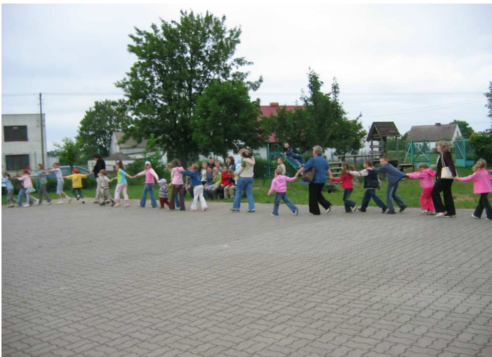
Festyn dla dzieci