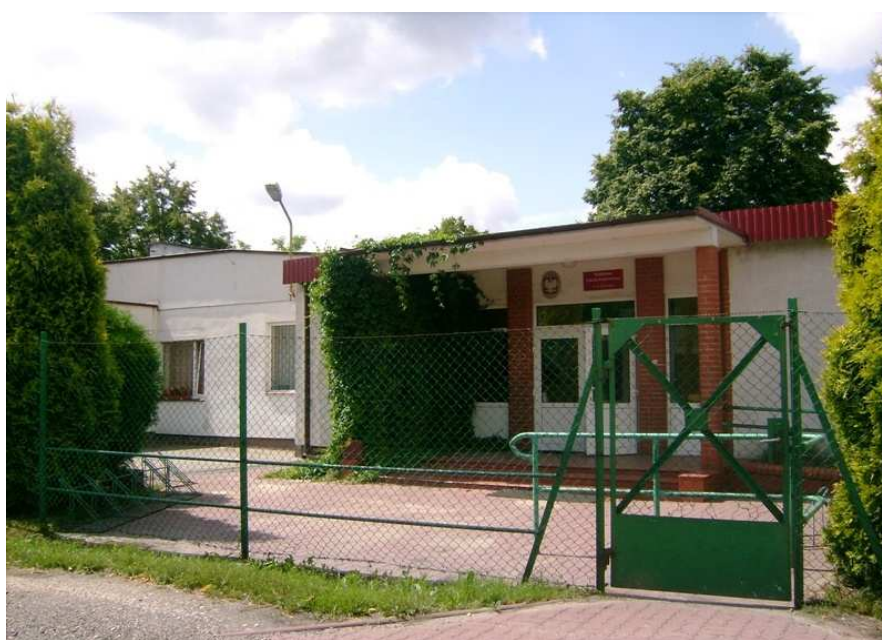
Szkoła Podstawowa w Ludzisku

Istotnym elementem rozwoju społecznego i miejscem integrującym lokalną społeczność jest Szkoła Podstawowa, Szkoła oprócz działalności dydaktycznej jest stałym organizatorem imprez kulturalnych i społecznych, Dzieci uczestniczą w różnych konkursach, festiwalach i zawodach sportowych. Do szkoły uczęszcza 122 dzieci. Przy szkole zlokalizowane jest boisko sportowe.