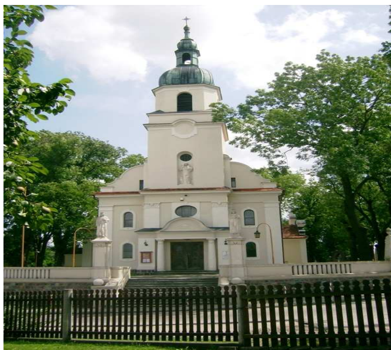
Kościół w Ludzisku