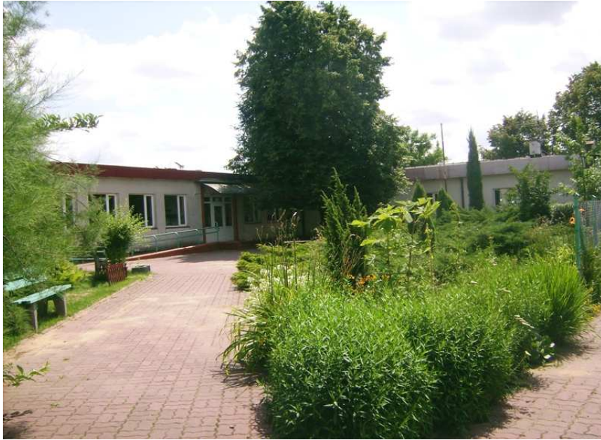
Szkoła Podstawowa w Ludzisku